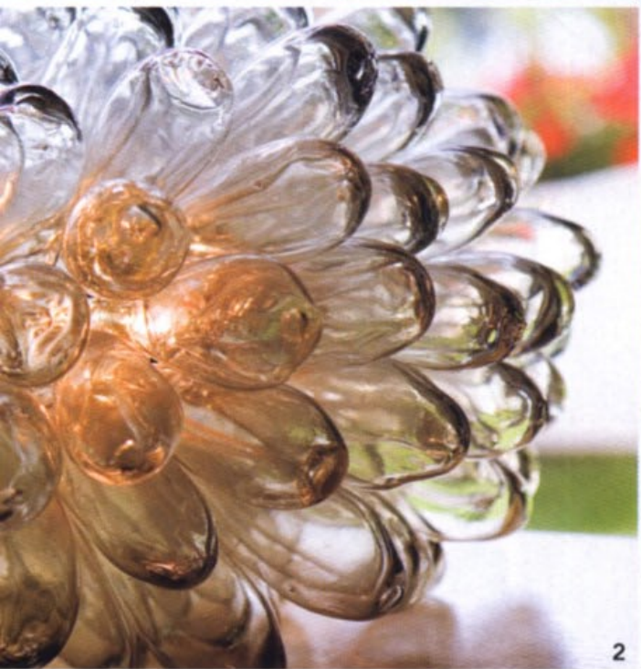
1. TERRAZA: las mesas en negro se combinan con sillas de aluminio muy livianas, para dar una sensación visual de ligereza. 2. DETALLE: de una lámpara del hall cuyo diseño recuerda las ramificaciones típicas de los fondos marinos. 3. ACCESO: a la terraza, flanqueado por dos grandes lámparas de zinc con pantallas de lino negro, de Contemporain Studio. Chaise longue Barcelona de Knoll y, al fondo, silla de Kartell.