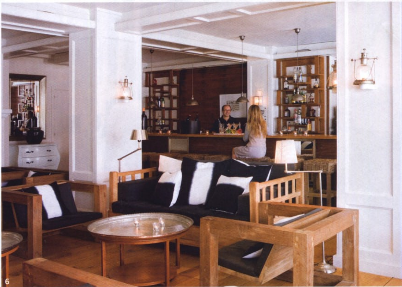
4. TIRADOR: de coral rojo, en una de las cómodas de Contemporain Studio. 5. RESTAURANTE: su decoración alterna blancos, negros y rojos, los sofás tapizados se alternan con sillas de diseño y líneas depuradas. 6. BAR: dedicado a Robert Ruarck, en él se combinan grandes sofás de madera de teca con cojines tapizados en gris y blanco con mesas de madera y sobre de alpaca diseño de Contemporain Studio.