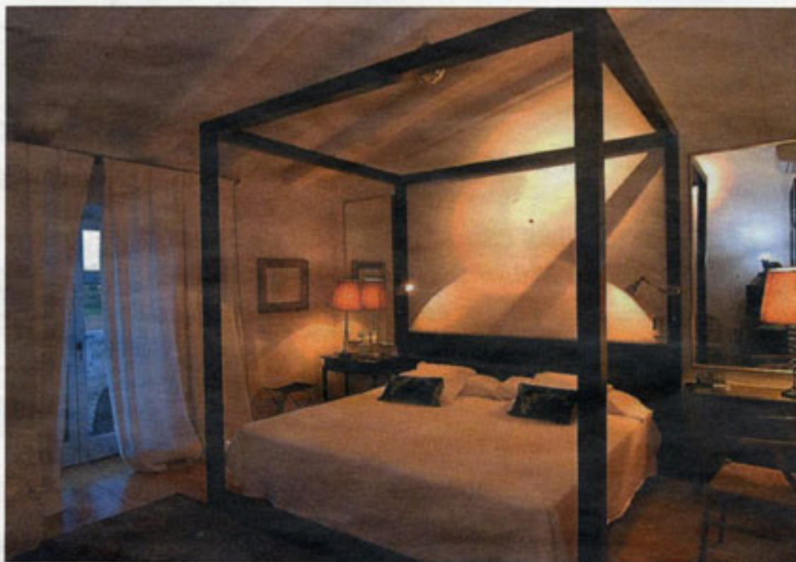
Una de las habitaciones del hotel La Malcontenta, en la playa de Castell, en Palamós.